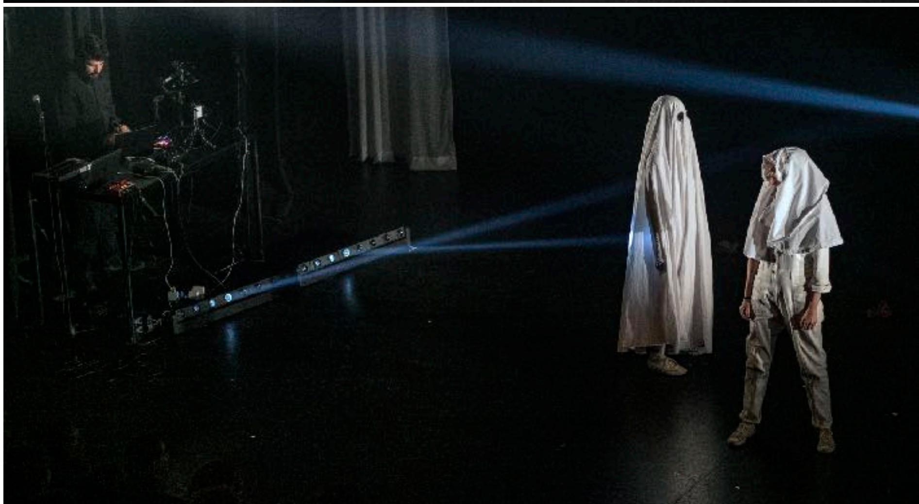
Fotografías de estreno en Teatro Echegaray Málaga son autoría de Daniel Pérez y Juan José Moya.